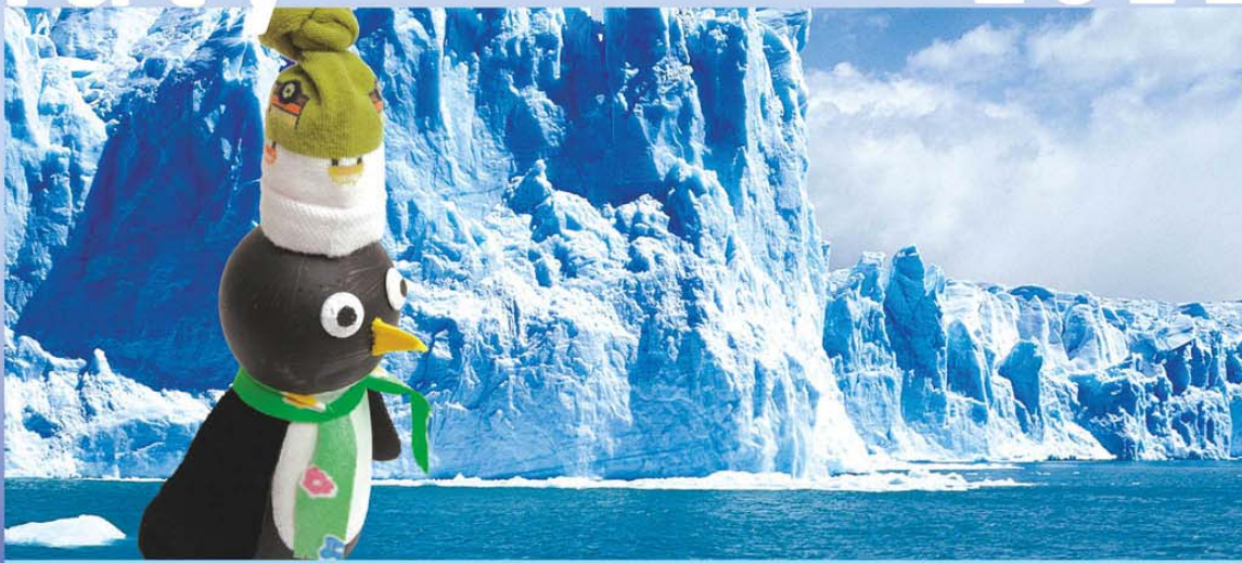
● Piotr Grel - 8,5 lat, Szkoła Podstawowa nr 314 w Warszawie „Pingwinek z butelki”