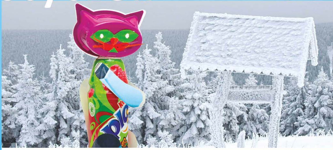
● Mikołaj Bielański - 4 lata, Przedszkole nr 3 w Brzegu Dolnym „Kotek”